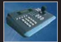
Tastiera per SPEED-DOME